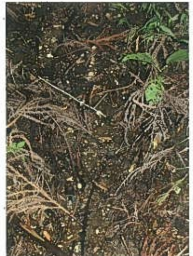
▲鎌倉岳付近の水源部