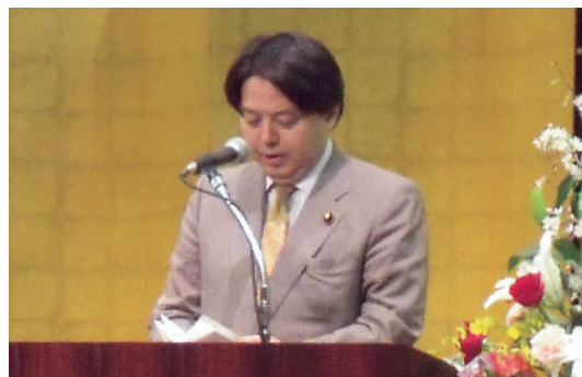
祝辞を述べる林農林水産大臣