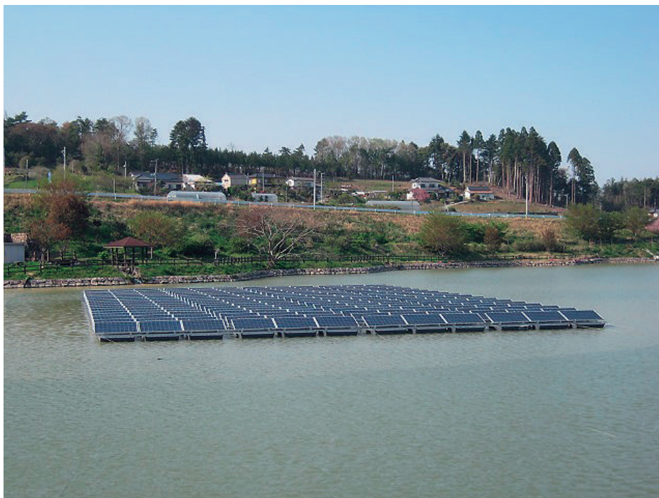
(本会：ため池の水面を利用したフロート式太陽光発電)

本会は、ため池（双葉郡広野町）の水面を利用した設備、南相馬土地改良区は、用水路敷地を利用した太陽光発電設備を建設し、農業水利施設の維持管理費軽減と地域農業の再生加速化に資することとしている。