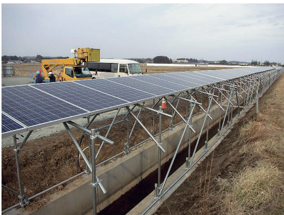
(南相馬土地改良区：排水路敷地を利用した太陽光発電)