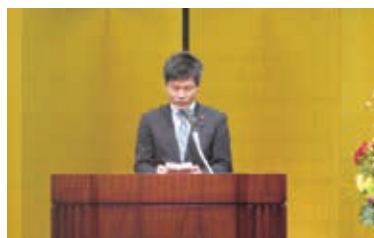
祝辞を述べる勝俣農林水産副大臣