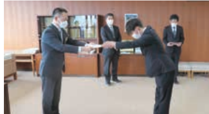
辞令交付式の様子