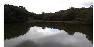
No. 5 堤体の上流全景 ファイル名: 2344600311311125-03.JPG