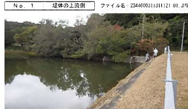
No. 1 堤体の上流側 ファイル名: 2344600311311121-02.JPG