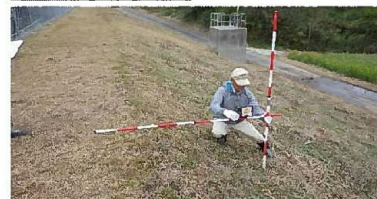
No. 3 取水施設 ファイル名: 2344600311311123-01.JPG