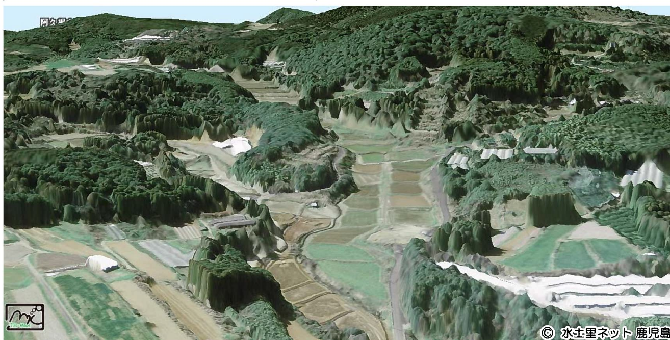
数値表層モデル(DSM)を用いた3次元地図