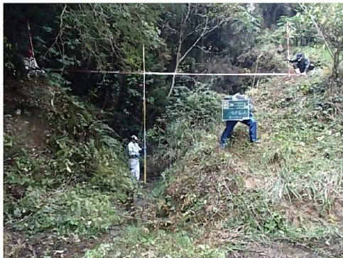
危険度の高いため池①(堤体の崩壊)

③このようなことから、突発的な豪雨や近年多発している大規模地震により決壊の恐れのあるため池を把握し対策を講じるために、平成24年の県営震災対策農業水利施設整備事業を活用し佐賀県、水土里ネットさがが中心となって、県内で一括して管理できるシステムを早急に構築する必要があった。なお、ため池台帳システムは平成26年度完成予定である。