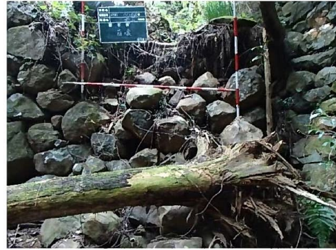
危険度の高いため池②(腰石積の崩壊)