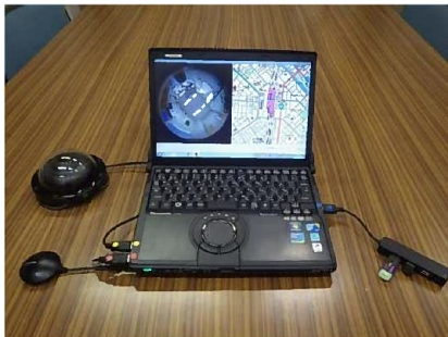
全方位カメラ機器