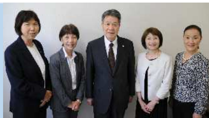
理事長、監事、3人の理事

豊川総合用水土地改良区(愛知県) 面積/ 15,055.9ha、組合員/ 22,603人 理事/ 理事19人(うち女性員外3人)