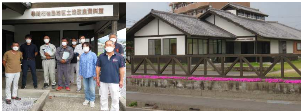
土地改良区事務所・串間市福島地区土地改良資料館

平成 7年6月 総代に選任 平成15年4月 理事に就任 平成23年4月 副理事長に就任 令和元年4月 理事長に就任