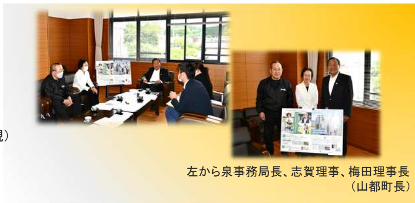
左から泉事務局長、志賀理事、梅田理事長(山都町長)