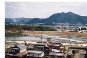
地域の農業を支える歴史ある栗用水